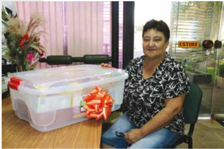
Familiar de Bornhold