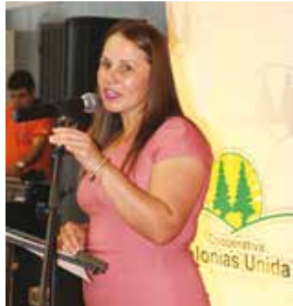
Gladis Rivarola Intendente de San Rafael del Paraná.